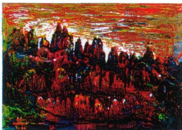
"La caresse du crépuscule", 1999, technique mixte