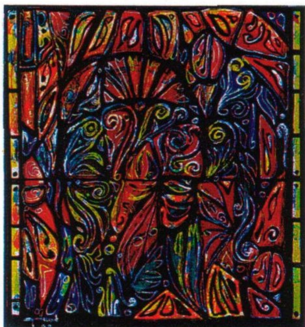
"Le culte du Totem", 1998, technique mixte